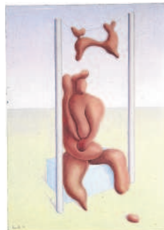
1936. Tubèrcul incúbic tot esperant l'hora seca. Oli sobre cartró.