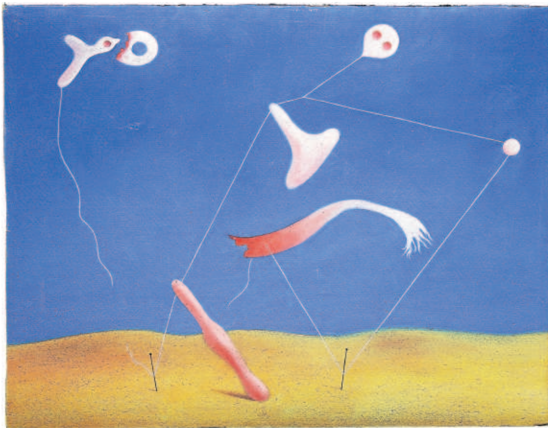
1936. Sense títol. Oli sobre cartró.