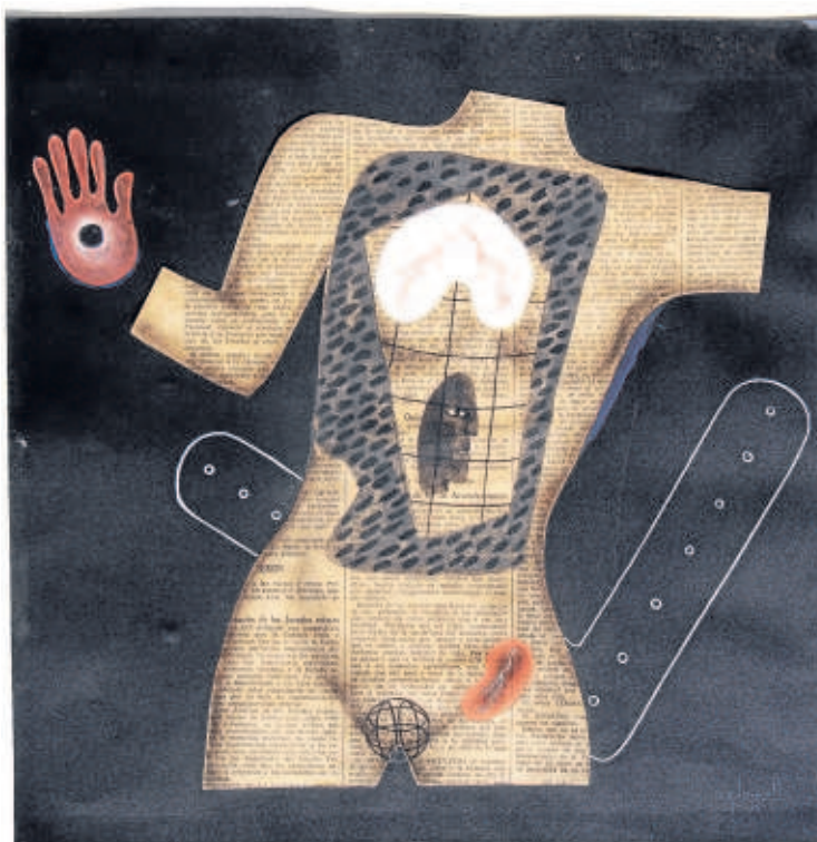
1935. Diari d'un psicoanalista. Guaix i diaris sobre cartolina.