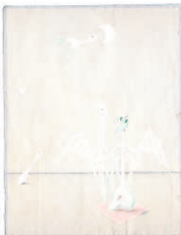
1936. Sense títol. Guaix sobre paper.