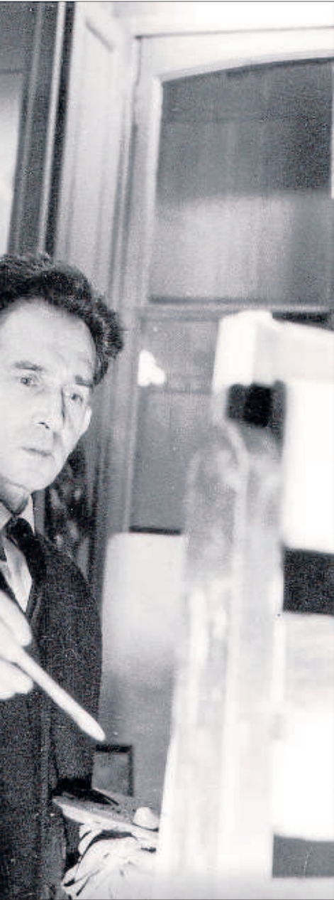
Dreux, on va morir el 1981.