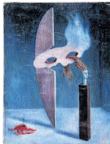
1935. Sense títol. Oli sobre tela.