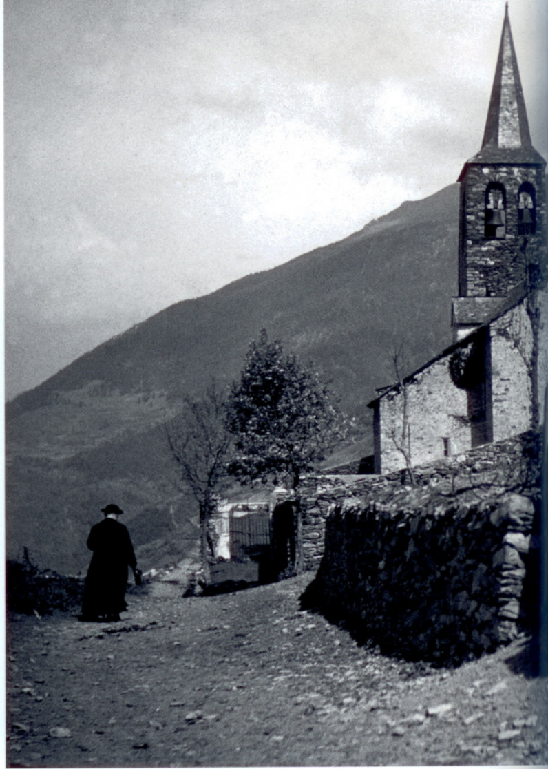
Dues instantànies del 1968: aplec de la Mare de Déu del Bon Repòs, a Sant Salvador de Toló, al Pallars Jussà, i Mont, a la Val d'Aran.