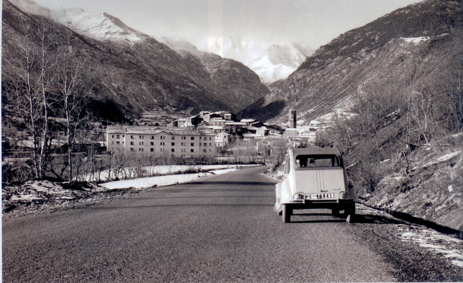
A la imatge superior, Vilaller, a l'Alta Ribagorça, publicada a Catalunya Visió 2 el 1968. A sota, vista aèria de la Seu Vella de Lleida ( Catalunya Visió , 1968).