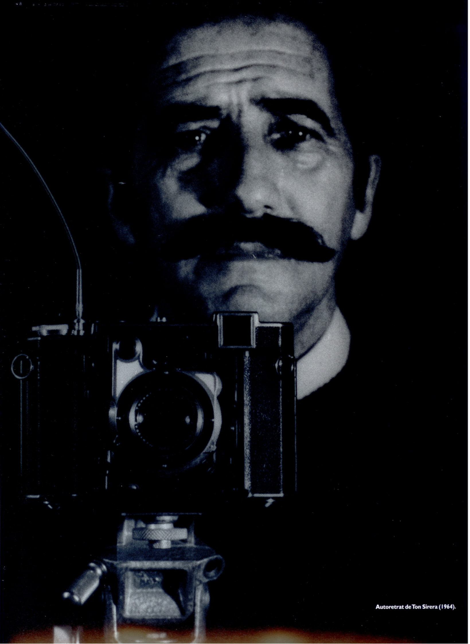
Autoretrat de Ton Sirera (1964).