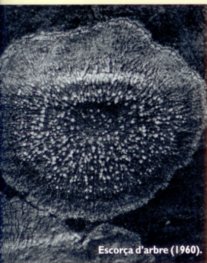
Escorça d'arbre (1960).

recorrido como fotógrafo de reportaje, aportando su particular mirada sobre la realidad en la ilustración de libros geográficos y de viajes. Con el escritor Josep Vallverdú publicó Els rius de Lleida y ocho de los diez volúmenes de la colección Catalunya Visió . Sirera se interesó igualmente a lo largo de su vida por el arte cinematográfico y, de forma análoga a sus descubrimientos en el campo de la fotografía abstracta, también experimentó con la imagen en movimiento. Fruto de esta pasión surgieron una serie de obras sorprendentes centradas en la abstracción fílmica, auténticas sinfonías visuales de impresionantes efectos rítmicos y cromáticos que han situado al artista en un lugar de honor en la historia del cine experimental de Cataluña.